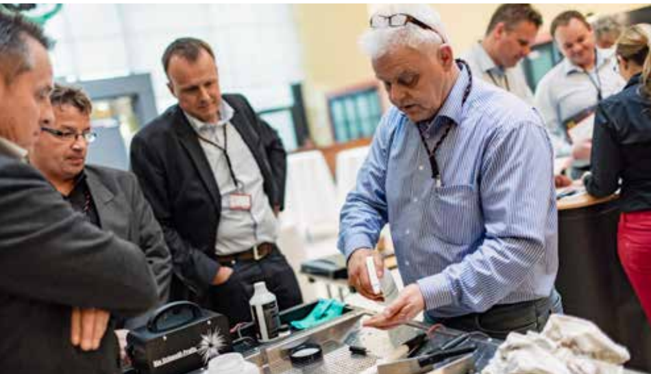
Insgesamt 31 Aussteller präsentierten ihre innovativen Produkte.