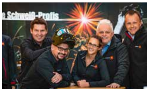
In Szene gesetzt: „Die Schweiß-Profis“.